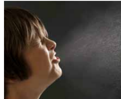
Door niezen en hoesten verspreiden griep- en verkoudheidsvirussen zich in de lucht.

Ventileer woon- en slaapruidten. Laat ventilatieroosters altijd iets open, of zet het raam op een kier (met anti-inbraakstang of slot).